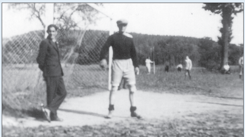
In den Dreissigerjahren lag der Fussballplatz in der Salzmatt, dort wo heute das neue Schulhaus steht.