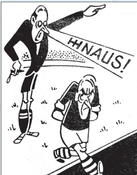
Eine Karikatur aus einem Sportmagazin der 40er-Jahre, welches auf Spezialseiten «regelrecht gespielt» die Fussballregeln erklärt.