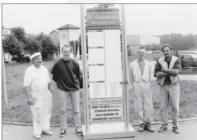
Mit einem durch die Gewerbebetriebe im Färch gesponserten Spendenbarometer lancierte der SCF eine äusserst erfolgreiche Spendenaktion.

In den damaligen wirtschaftlichen Zeiten – der Gemeinderat hatte für das Budget 1996 über 300 000 Franken gestrichen – stiess die Vorlage aber auf Widerstand. Das Geschäft wurde zurückgewiesen mit dem Auftrag, neue Finanzierungsquellen zu suchen. Die Verwerfung an der Gemeindeversammlung wurde aber nicht als Niederlage, sondern als Chance verstanden. Am 10. Dezember 1996, also ein Jahr später, konnte der Verein mit einem neuen Finanzplan erneut vor die Gemeindeversammlung treten. Durch die Erträge aus dem Jubiläumsfest, durch Spenden und schriftlich zugesicherte zinslose Darlehen standen dem Verein 160 000 Franken zur Verfügung. Vor diesem Hintergrund wurde vom Souverän der einmalige Beitrag von 90 000 Franken bewilligt, welcher es ermöglichen sollte, Duschen und Garderoben im geplanten Clubhaus zu integrieren.