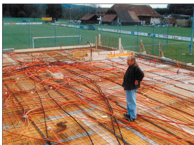
Architekt Otto Jäggi war für den Bau des Clubhauses verantwortlich.