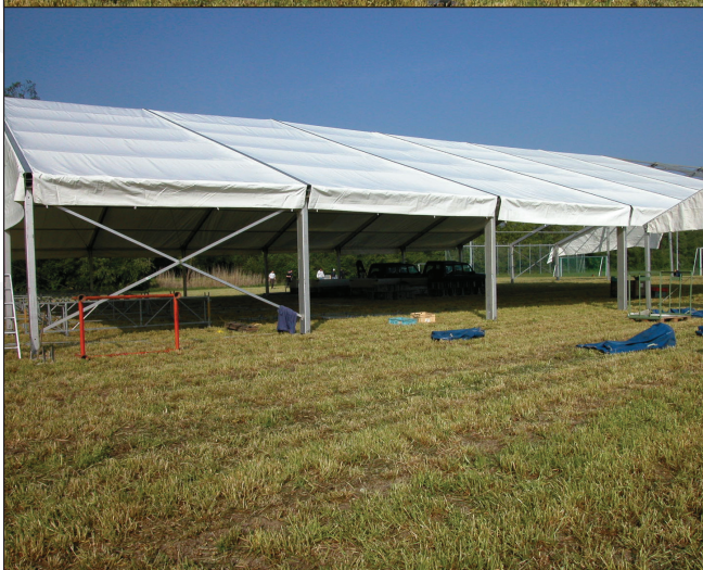
Bis das Festgelände bereit war, gab es unzählige Arbeiten zu erledigen.